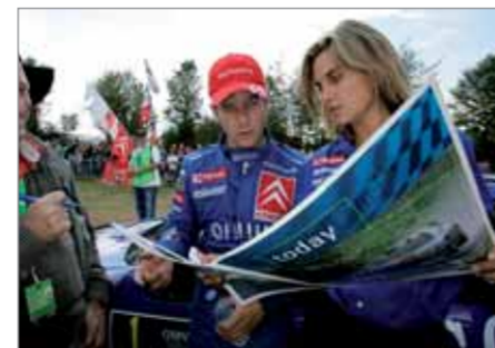
SEB, DARF ICH ES DIR VORLESEN?