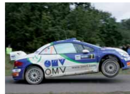
... UND ABHEBEN

Die Panzerplatte mit ihren mehr als 30 Kilometern Mutprobe ist jedes Jahr das Nonplusultra der OMV ADAC Rallye. Im ersten Durchgang auf teils noch feuchter Piste beherrschten die Citroen-Piloten Daniel Sordo und Sébastien Loeb den Ritt durch die Beton-Hölle von Baumholder vor Mikko Hirvonen im Ford Focus am besten. Marcus Grönholm, inzwischen nach einigen Änderungen mit seinem Ford wieder zufrieden, mutierte erstmals bei der 2006er Deutschland zum fliegenden Finnen. Die Zwei-Zacken-Air Force jedoch ließ sich nicht abschütteln – Rückstand von Sordo eine (!) Zehntelsekunde, Loeb eine Sekunde. Beim zweiten Turn durch Erweiler zeigten sich aber die Xsara etwas flügel-lahm, Loeb hatte aber die Begründung parat: „Ich bin mit weichen Reifen vorsichtig gefahren – zur Schonung für die nächste Prüfung.“