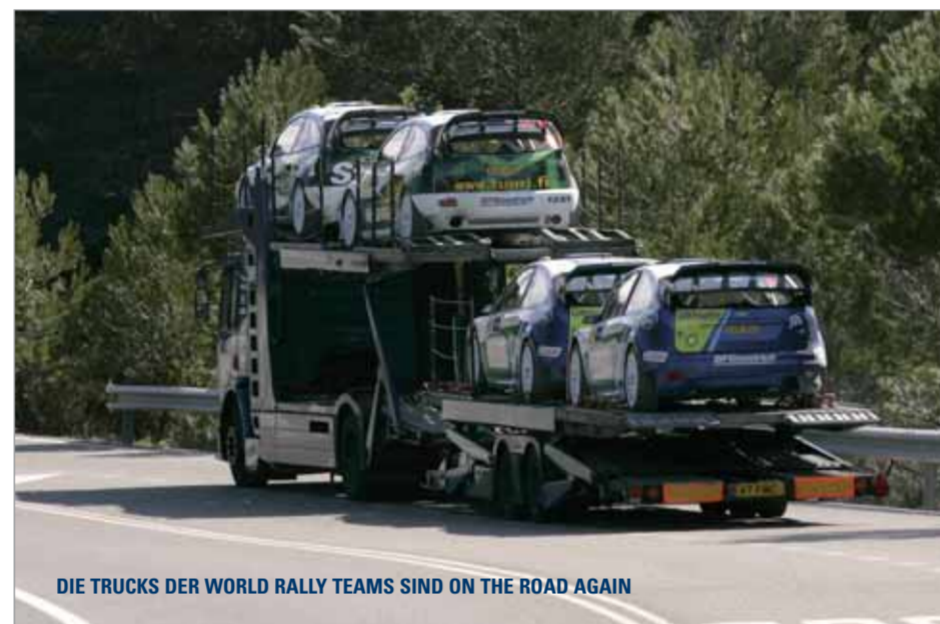
DIE TRUCKS DER WORLD RALLY TEAMS SIND ON THE ROAD AGAIN