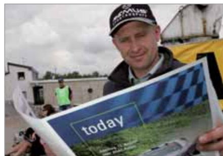
SCHWARZ: MENSCH MAIER, GUT RECHERCHIERT