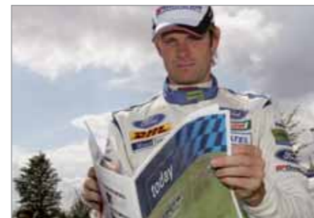
GRÖNHOLM: WO IST DER FINNISCHE COMIC-STRIP