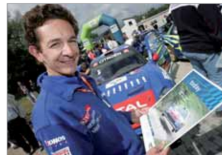
VAN DALEN: GAR NICHT KLEIN UND DENNOCH FEIN