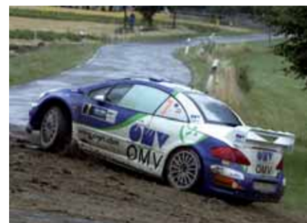
SCHWUNG HOLEN ...