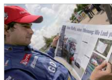
LOEB-CO ELENA: MEIN CHEF KANN SCHON WAS