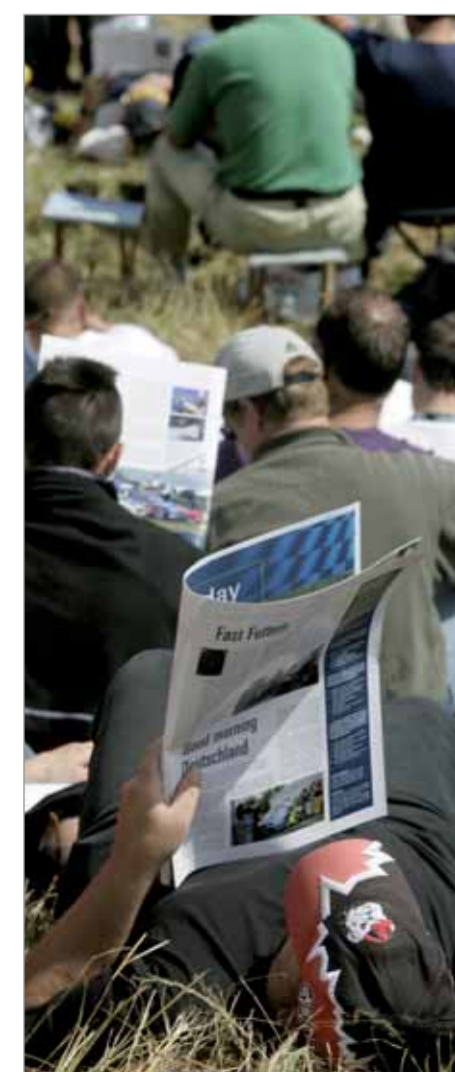
TODAY IS TOMORROW - BIS 2007