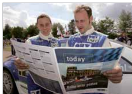
MINOR UND STOHL: SCHÖNE GROSSE BILDER

In den vergangenen drei Jahren gab es 12 Ausgaben der OMV ADAC Today. Begonnen haben wir im A4 Format mit vier Seiten Umfang. Ihre Akzeptanz hat uns dazu veranlasst, dass wir das Tageszeitungsprojekt Jahr für Jahr ausgebaut haben. Heute sind es bereits 12 A3-Seiten. Wir hoffen, dass Ihnen das Lesen der OMV ADAC Today Spaß gemacht hat. Von einigen Stars der Rally-Szene wissen wir es.