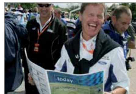
M-SPORT BOSS WILSON GAR NICHT BRITISCH